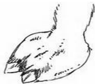
Pied du dromadaire

Le dromadaire ferme ses narines pour se protéger du sable lorsqu'il y a du vent et ses yeux sont aussi protégés par de longs cils.